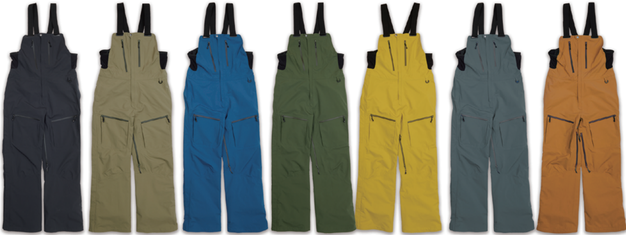
1.SUMI 2.SAGE 3.BLUE 4.SHIDA 5.LEMONE 6.SLATE 8.APRICOT