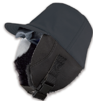
1.SUMI / BLACK