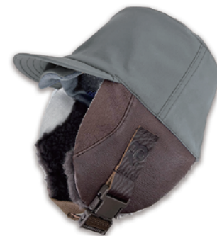
3.SLATE / D.BROWN

Style No. PRM-27884 Size S+(54) M+(57) L(59) L+(60) XL+(62) Price ¥18,000 + TAX