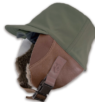
2.SHIDA / CHOCO