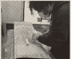
Hand Build by Shuichi Hirayama